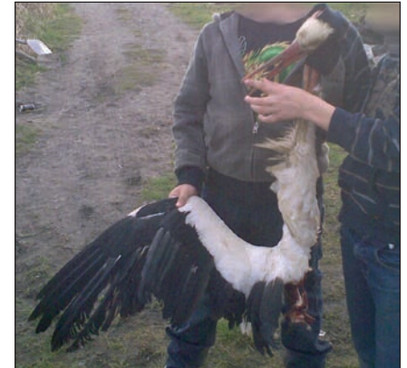
Vogelschlag Windenergieanlage Ochsenerwerder Ostern 2010